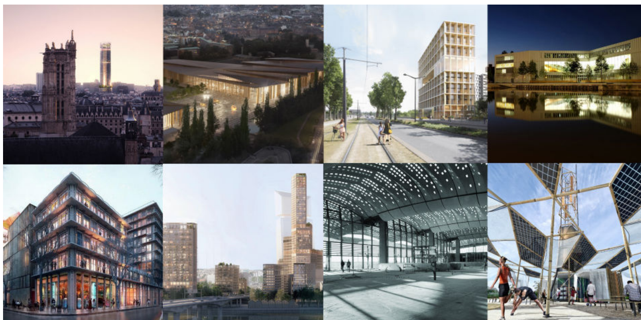
Quelques projets en cours ou livrés, Tours Montparnasse, Parc des expositions de Strasbourg, Bibliothèque de Caen...